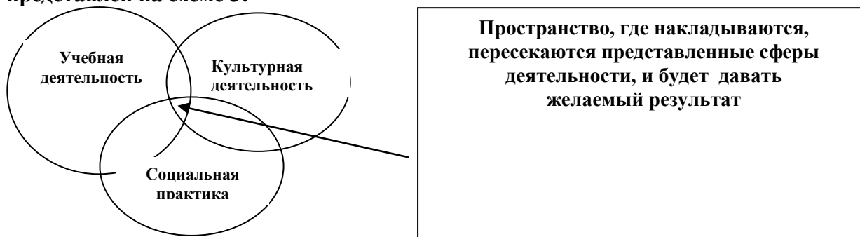
Рис.3. Механизм достижения результата при формировании УУД, самоопределении на самостоятельную деятельность в рамках модели «Школа – социокультурный центр»

Механизм достижения результата при формировании УУД, самоопределении на самостоятельную деятельность в рамках модели «Школа – социокультурный центр» представлен на схеме 3: