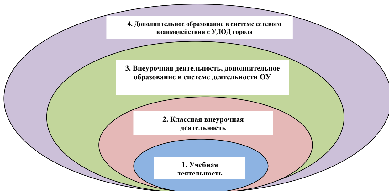
Рис.2. Модель «Школа – социокультурный центр»

1 - учебная деятельность: технологии и формы обучения по ФГОС НОО;