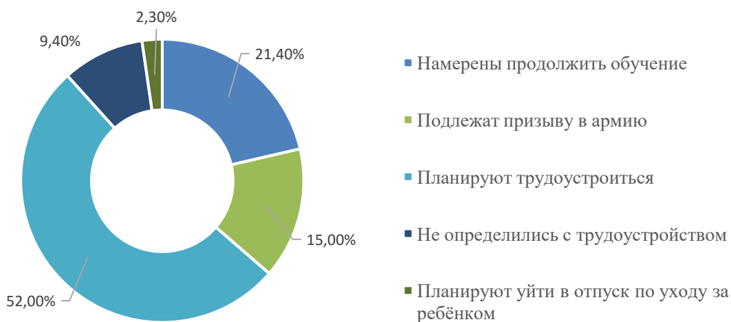
Рис.1. Прогноз распределения выпускников ПОО и ООВО по каналам занятости на 01.08.2019 г.

Графически данные прогноза распределения выпускников ПОО и ООВО по каналам занятости по состоянию на 01.08.2019 года представлены на рисунке 1.